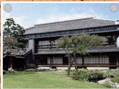
岡部記念館金鈴荘