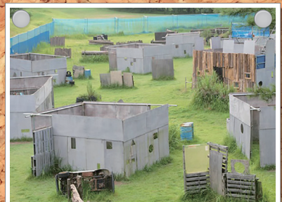
ターフバトルフィールド