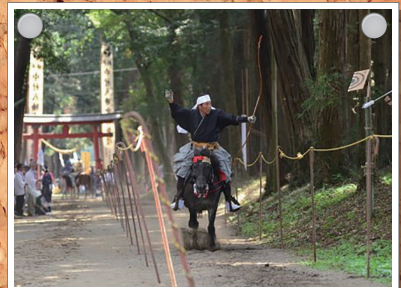
中村八幡宮例大祭(流鏝馬)

JCI 一般社団法人 真岡青年会議所 〒321-4305 栃木県真岡市荒町1203(真岡商工会館内) TEL:0285-82-6666 http://www.moka-jc.org