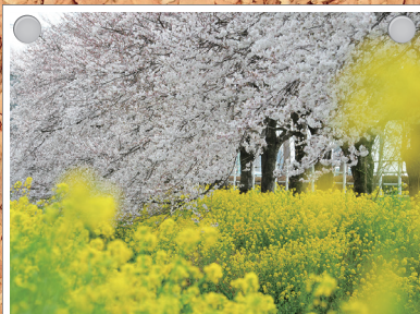
二宮道の駅の桜と菜の花