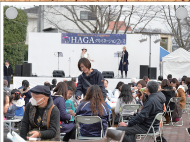
HAGAグルメネーション