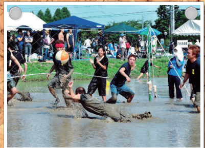
どろんこバレーボール