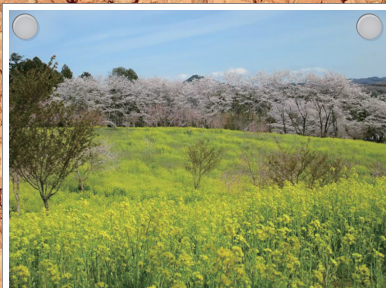
益子の古墳群の菜の花