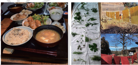
↑マクロビオティック料理 草木染め体験↑

住所: 〒321-4217 栃木県芳賀郡 益子町益子4135 TEL: 0285-81-6797