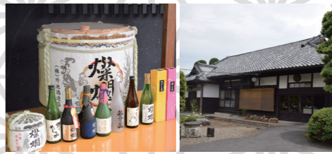
↑外池酒造店ならではの商品を販売

住所: 〒321-4216 栃木県芳賀郡益子 町塙333-1 TEL: 0285-72-0002