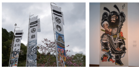
↑江戸時代から続く男子誕生を祝うのぼり

住所: 〒321-3412 栃木県芳賀郡 市貝町田野辺723 TEL: 0285-68-0108